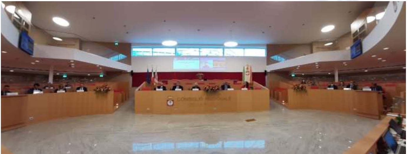
Bari, 28 ottobre 2021 – Assemblea plenaria presso il Consiglio regionale della Puglia