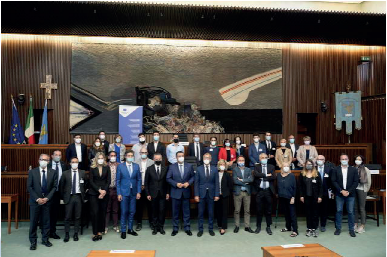
“Dare forma alla casa della democrazia europea”, Trieste, 22 settembre 2021