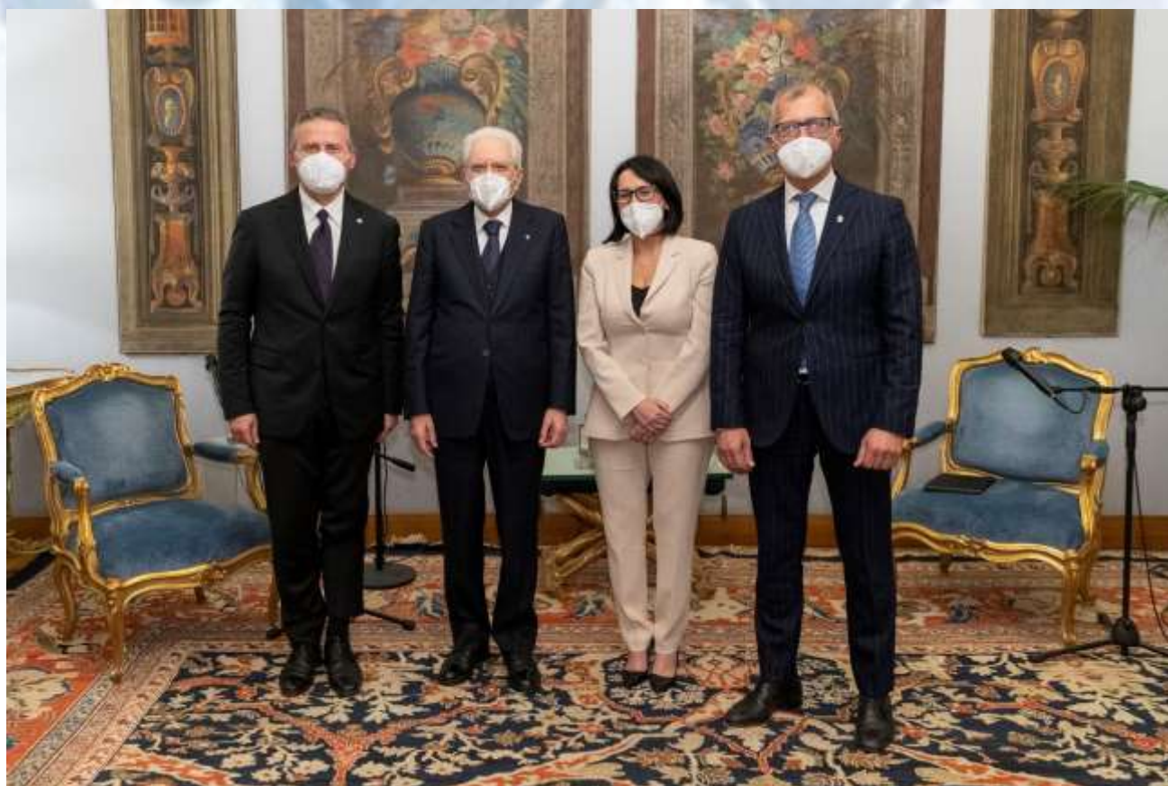
Quirinale, 19 novembre 2021 – L'Ufficio di Presidenza della Conferenza in udienza dal Presidente Mattarella