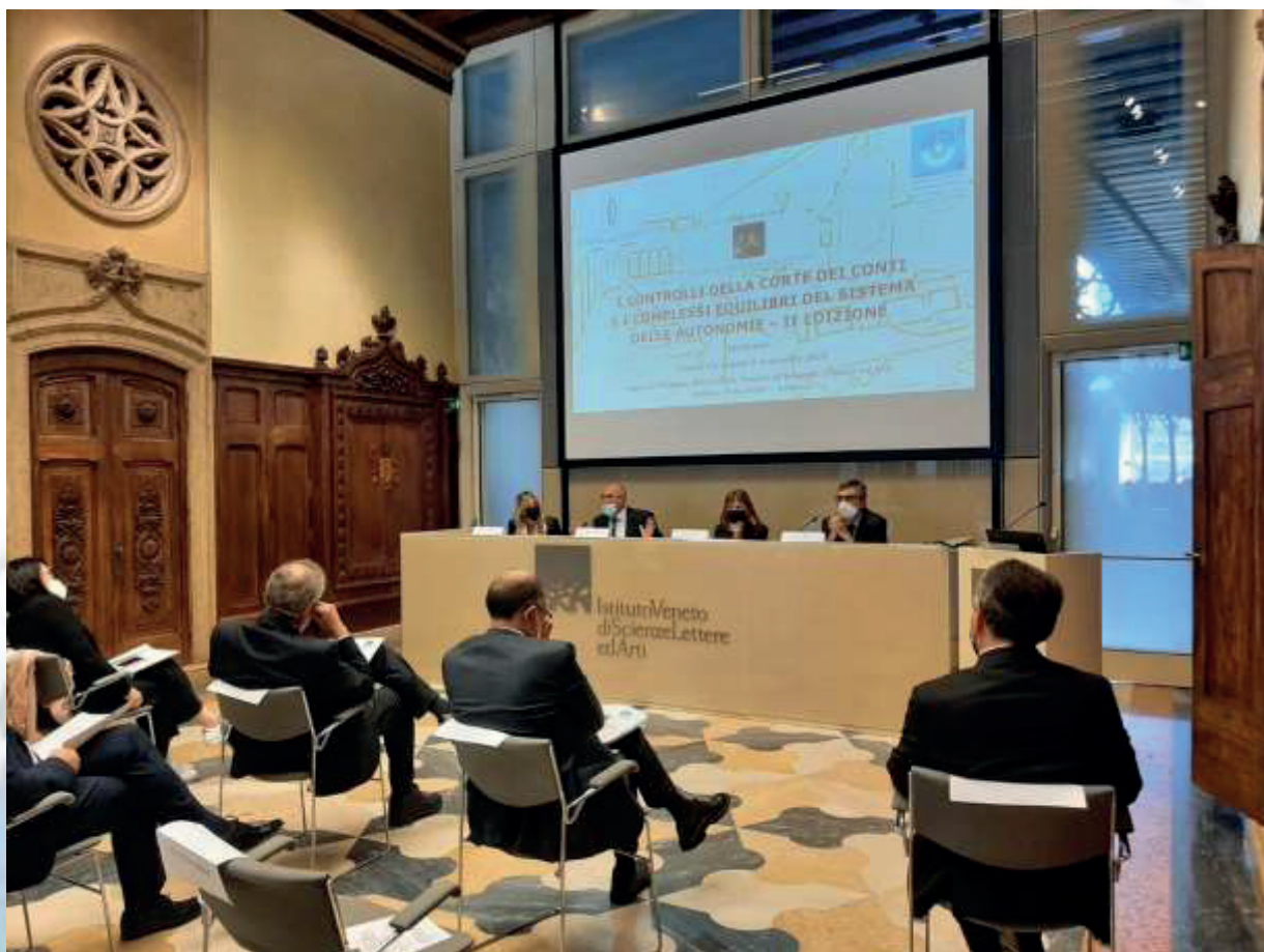
5 e 6 novembre 2021 – Venezia, Seminario “I controlli della Corte dei conti e i complessi equilibri del sistema delle autonomie”