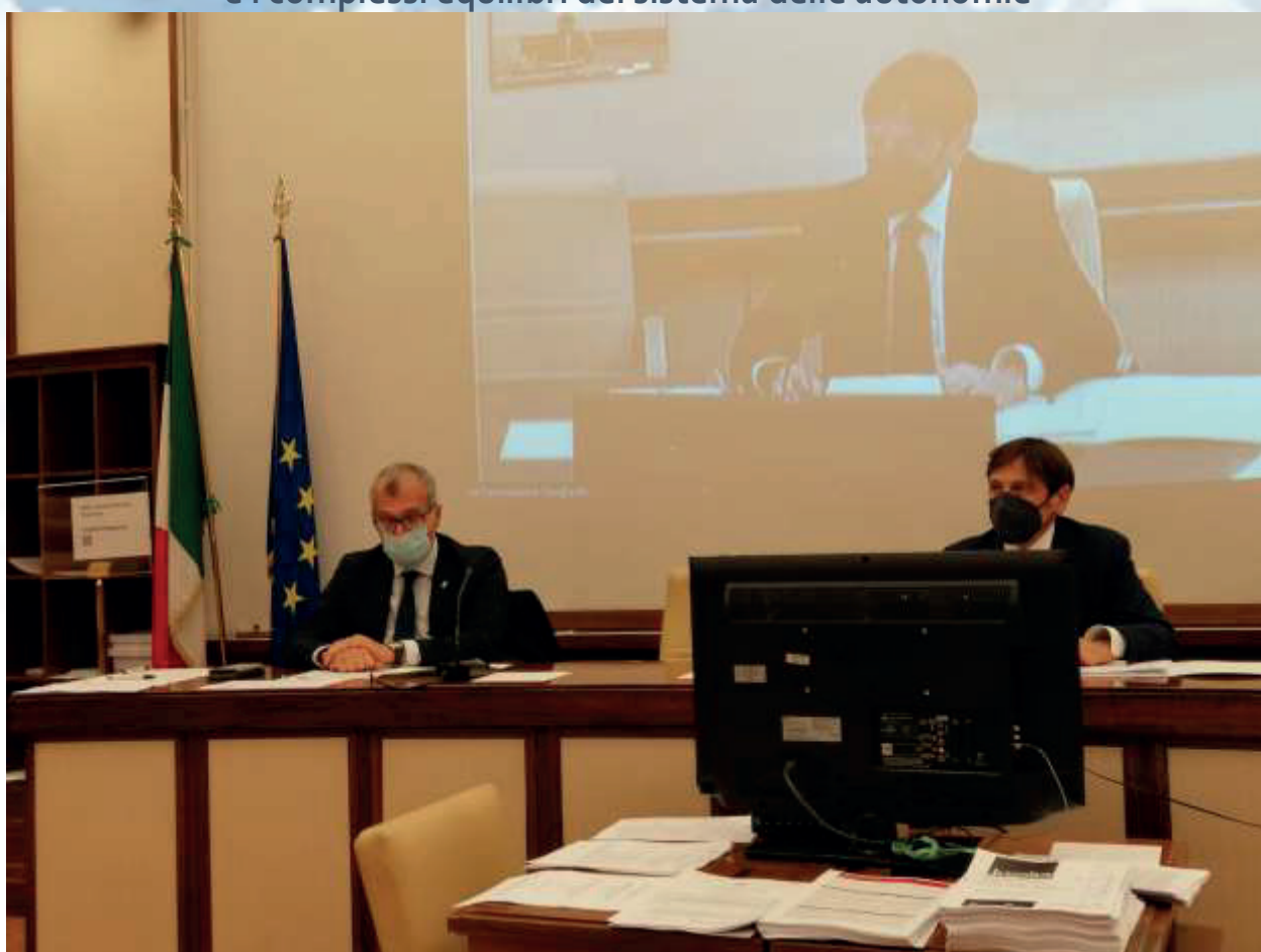
8 novembre 2021 – Audizione del Presidente Zanin presso la III e XIV Commissioni congiunte del Senato