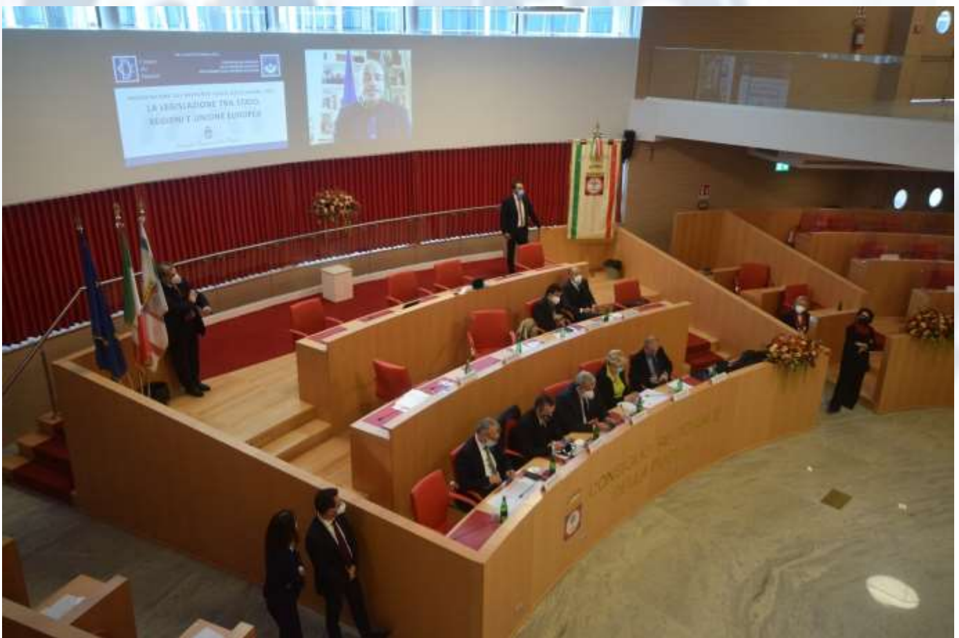
Bari, 29 ottobre 2021 – Presentazione del Rapporto sulla legislazione presso il Consiglio regionale della Puglia