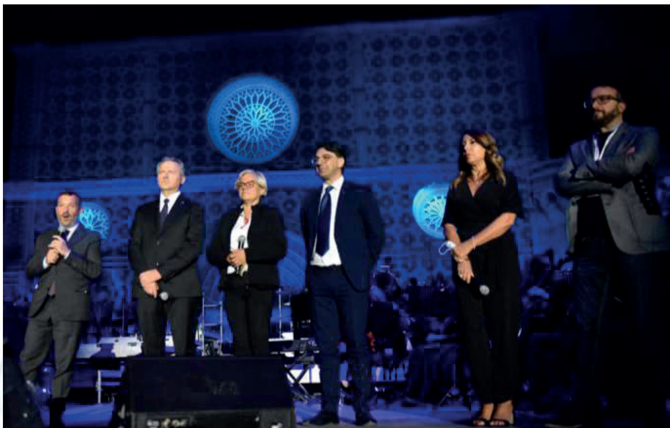
I Presidenti Sospiri, Ciambetti, Capone e Cicala – Basilica di Collemaggio (AQ) – 30.08.21