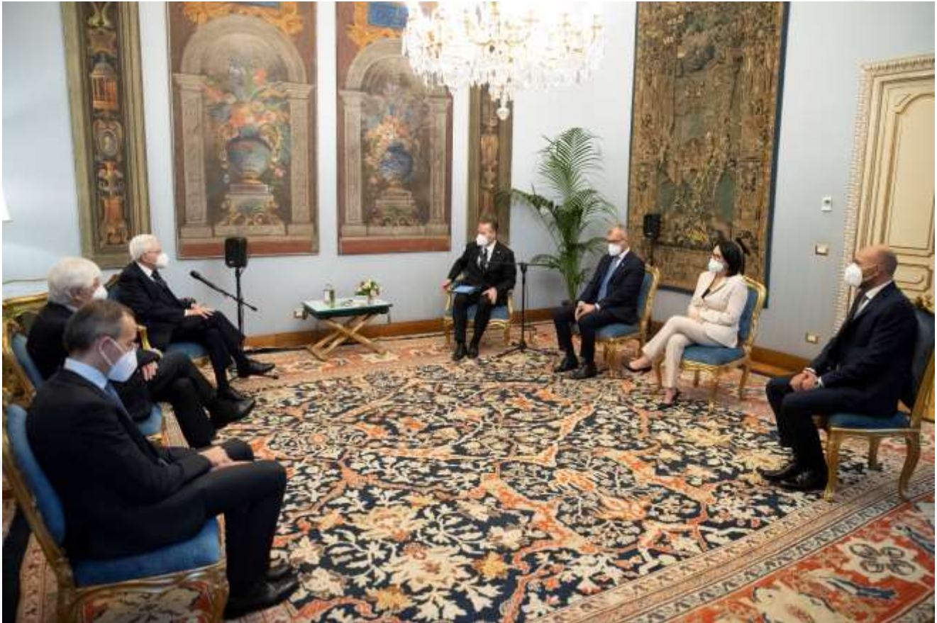
Quirinale, 19 novembre 2021 – L'Ufficio di Presidenza della Conferenza in udienza dal Presidente Mattarella