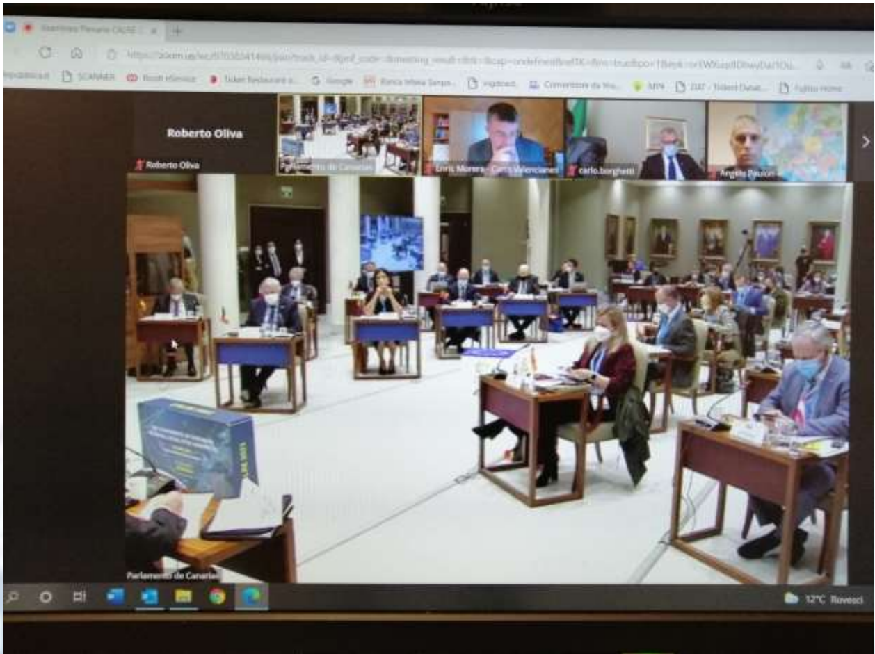
Tenerife (ES), 26 novembre 2021 – Assembleia plenaria della CALRE