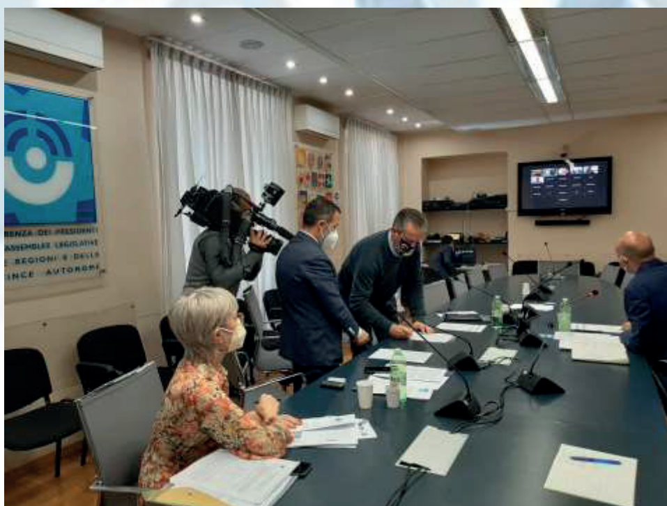
Firma dell'accordo di partenariato per il Progetto PARCOVIE – 26.07.21